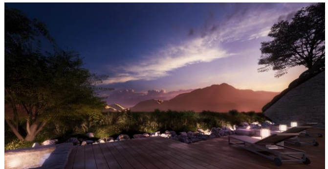
プール外デッキイメージ