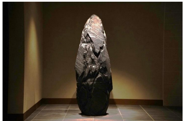
彫刻の森美術館監修のアート作品