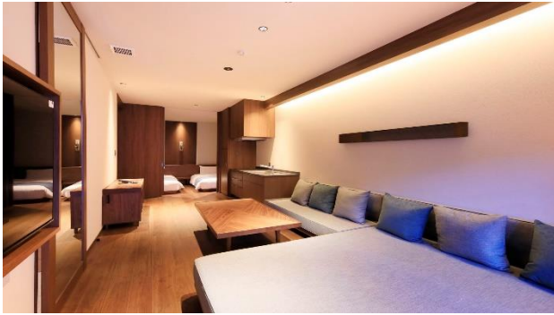
露天風呂付き客室

エントランスから続く中庭のファイヤープレイスは、箱根の自然をモチーフにデザインしており、火を囲んで滞在中の静かなひとときをお過ごしいただけます。また、本館と温泉棟をつなぐ屋外テラスでは、四季折々の箱根・仙石原の移ろいを感じることができます。温泉大浴場では大涌谷の眺めを楽しむことができます。