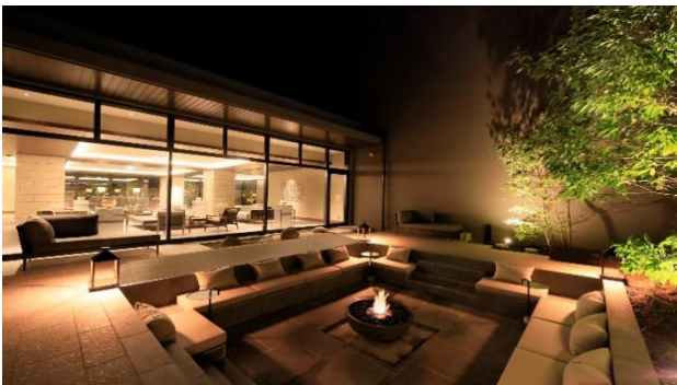
ファイヤープレイス