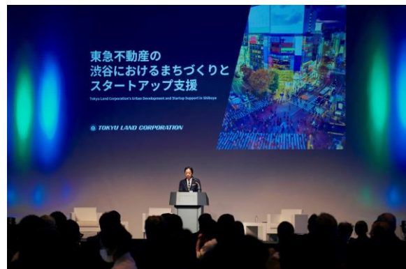
右) 当社役員による「渋谷におけるまちづくりとスタートアップ支援」概要のプレゼン