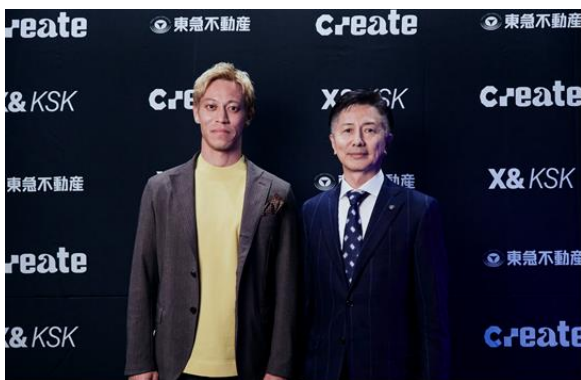
左) 本田 圭佑氏と当社代表取締役

また、会場内のネットワーキングスペースでは、2024年1月に発生した能登地方を震源とする地震で被災された方々を支援するため、北陸の食材を用いたフード/ドリンクの提供や食器の使用およびチャリティーを実施いたしました。