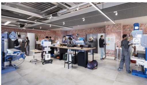
「(仮称) Shibuya Deep-tech Accelerator」 イメージ