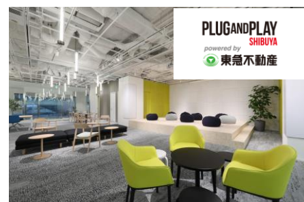
「PLUG AND PLAY SHIBUYA」