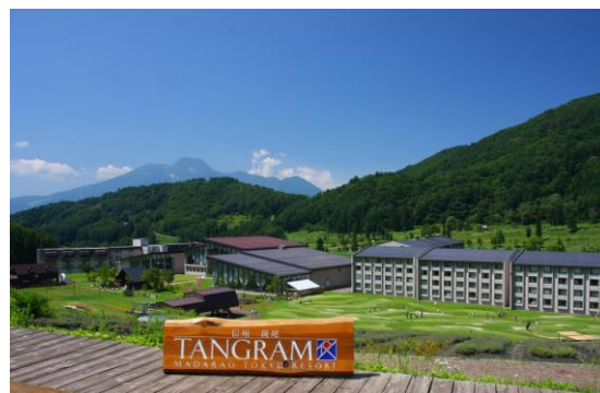
タングラム斑尾東急リゾート（認定番号：94）