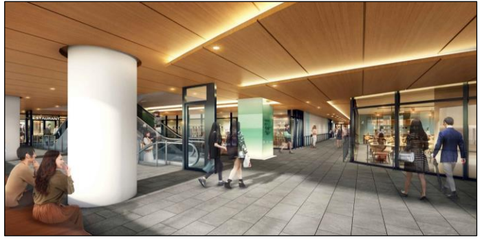
商業施設イメージ