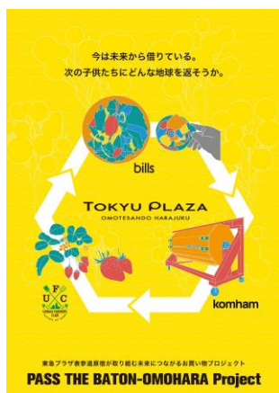
PASS THE BATON-OMOHARA