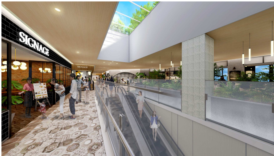
STATION1 棟 3F 内部イメージ