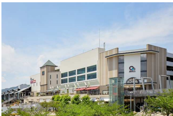
CENTER 棟 外観写真