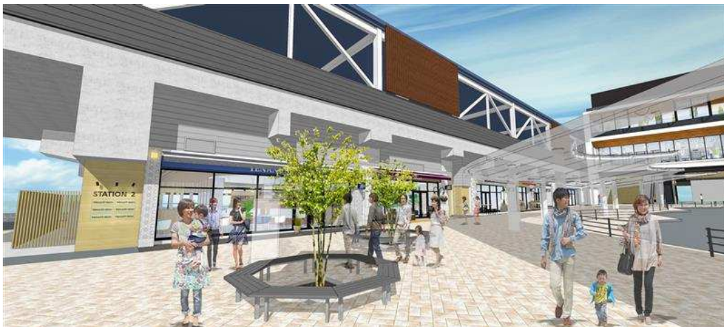
STATION 2 棟 外観イメージ