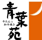
牛たんと和牛焼き 青葉苑