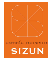
sweets museum SIZUN