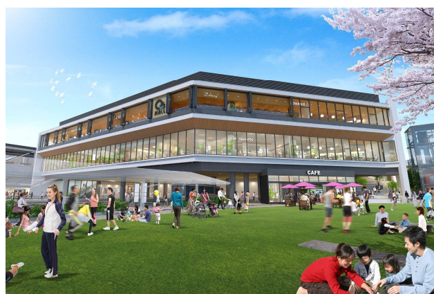
STATION1 棟 外観イメージ