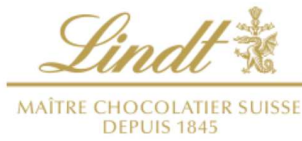
リンツ ショコラ ブティック