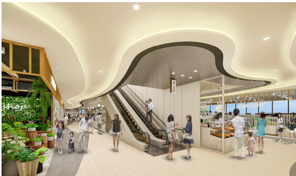
STATION1 棟 2F 内部イメージ