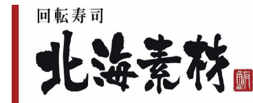
回転寿司 北海素材