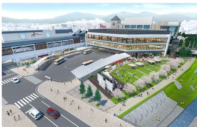
施設及び新駅外観イメージ

STATION 棟は「日常を輝かせる、ちょっといいこと」をコンセプトとし、既存の「みのおキューズモール」6棟と一体で運営を行っていきます。通勤・通学時のついで買いニーズに応えるとともに、生活に彩りを添えるテナントも揃えることで、まちのにぎわいの起点となる施設をめざします。