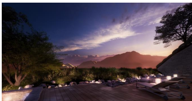
プール外デッキイメージ