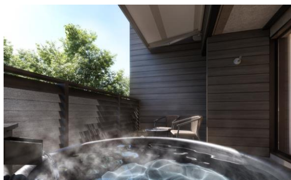
客室温泉露天風呂イメージ