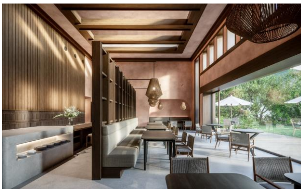
レストランイメージ

地元食材を中心に使用した健康志向のイタリアンレストラン。お客様の心と身体を整えるをコンセプトに地元野菜を多用したシェフ自慢のスペシャリテをお楽しみいただけます。