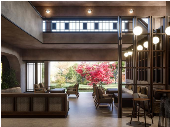
ロビーラウンジイメージ

本ホテルの前身「東急ハーヴェストクラブ箱根明神平」は、「東急箱根明神平別荘地（サニーパーク）」の中央に位置する会員制ホテルとして、長く会員の皆様にご愛顧いただきました。会員制ホテルとして満期を迎えるとともに改装を実施し、解放感あるエントランスロビーはそのままに、素朴で優しい風合いで設えたデザイン空間にリニューアルしました。森に囲まれたくつろぎを建物内でも感じていただき、雄大な山々を眺める中庭とともに、やすらぎのひと時をお楽しみいただけます。