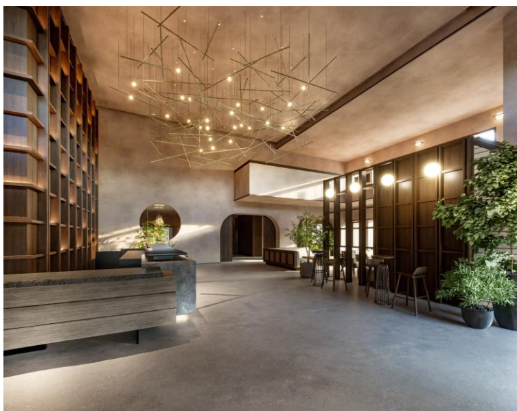
ロビーラウンジイメージ

「nol hakone myojindai」は、当社が1993年に開発した会員制ホテル「東急ハーヴェストクラブ箱根明神平」を改装し、2024年5月に当社ホテルブランド「nol」として、リブランドオープンするリゾート施設となります。人気の観光地箱根の中でも閑静な宮城野エリアの別荘地内に所在し、お客さまが「自分らしく、普段通りに、その地域を楽しめる」ホテルをめざします。なお、予約受付は11月1日（水）より開始いたします。