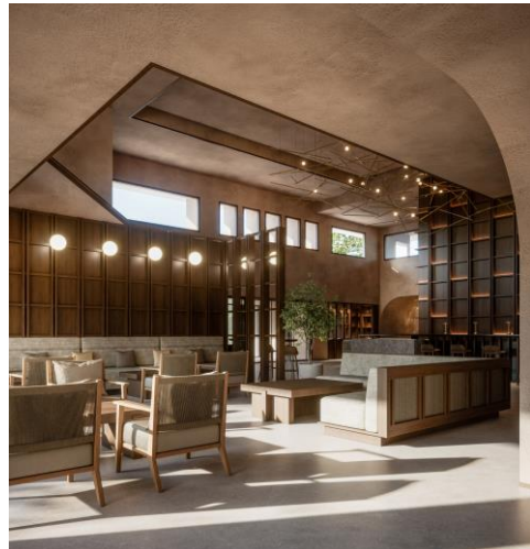
ロビーラウンジイメージ