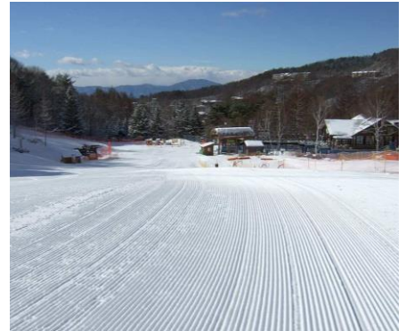
<長野県> 蓼科東急スキー場