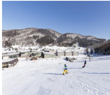
<長野県> タングラム斑尾