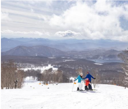
<群馬県> たんばらスキーパーク