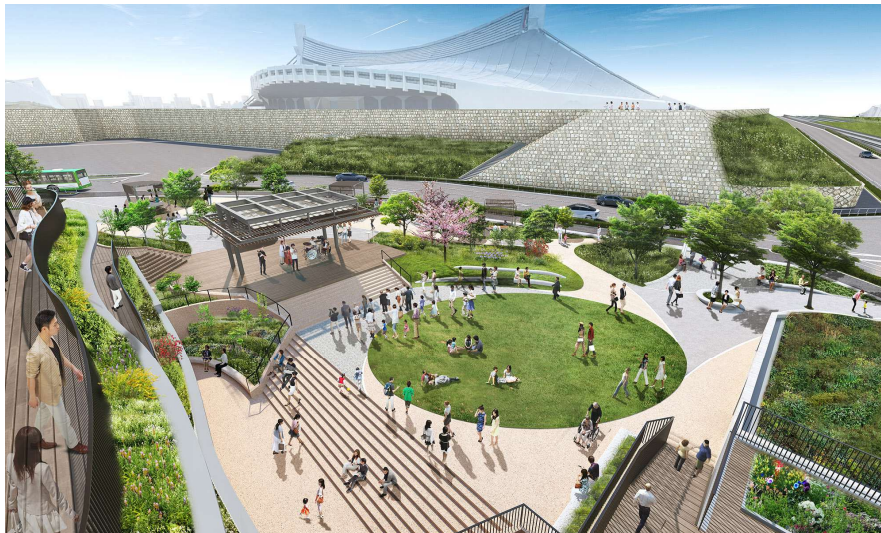
公園および施設イメージ

都市公園において飲食店・売店などの公園利用者の利便性の向上に資する公園施設（公募対象公園施設）の設置と、設置した施設から得られる収益を活用して、その周辺の園路・広場などの公園施設（特定公園施設）の整備などを一体的に行う民間事業者を公募により選定する、都市公園法において定められる制度。