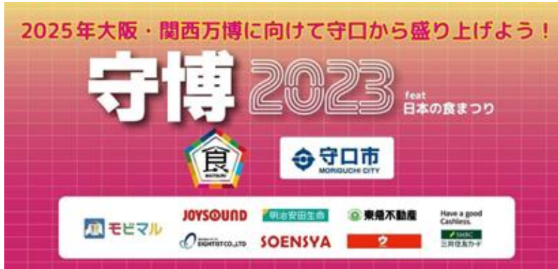
2023年11月「守博 2023 feat.日本の食まつり」協力

※日本の食まつりホームページ： https://nippon-food-fes.com/