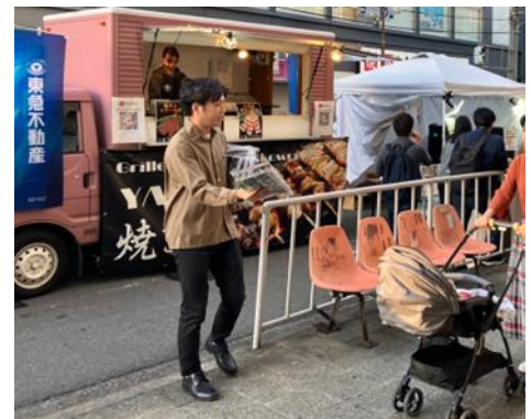
2023年社会実験「守口さんぽ vol.3」に参加

https://www.instagram.com/moriguchi.sampo/