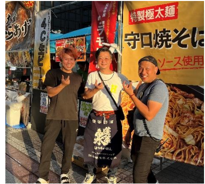
2024年10月「守博 2024 feat.日本の食まつり」協力