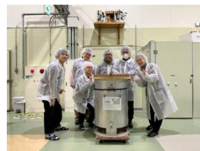
ウラムリ酒の樽入れイベントに参加