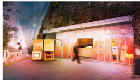
「ハラカド開業記念ルーフトップイベント」実施イメージ