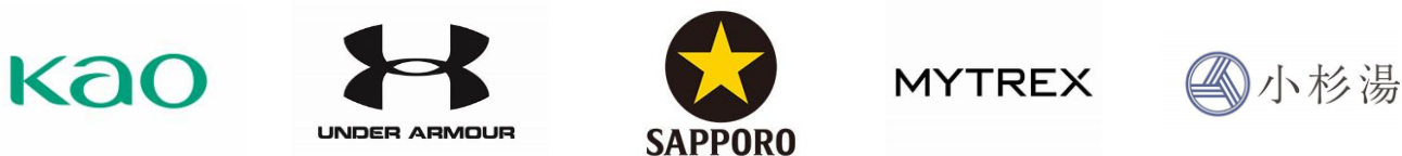
チカイチ各社ロゴ

それぞれの企業が最も大切にしている価値や想いにどっぷり浸れる場づくりに一丸となって挑戦していきます。原宿というこの街であえて素に戻れる場所「チカイチ」で本質や素に出会い、商品やブランドに浸れる体験をお楽しみください。