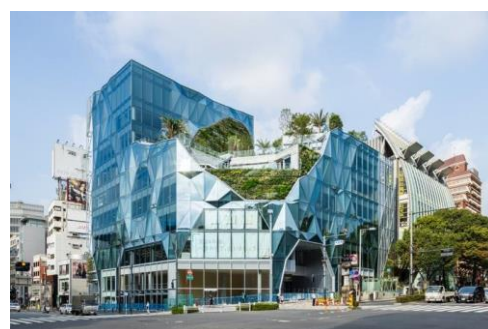
東急プラザ原宿「ハラカド」外観(昼景)

※東急不動産 SC マネジメント株式会社、東京地下鉄株式会社、株式会社コロバン所有床含む (同建物内に別途、渋谷区・株式会社邱プラン所有床あり)