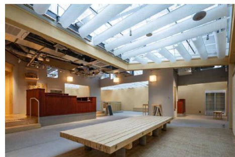
「チカイチ」イメージ

このコンセプトに共感した花王株式会社（以下、「花王」という）は、小杉湯原宿との協業を通じて、清潔・清浄にまつわる様々な体験の場を創造し、積極的な情報発信をしております。花王が創業以来販売を継続している「花王石鹸（現：花王ホワイト）」をテーマに、花王の「素」である清潔・清浄文化や歴史の世界を体験できる企画を実施します。