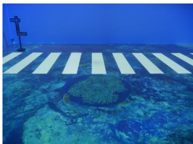
NATURE CROSSING イメージ

HYTEK 社と協業し、第一弾としてパラオを題材にした没入型の体感コンテンツを提供します。地面に広がるのは、遠く離れた南国のビーチなど地球上に実在する景色。アスファルト上に敷かれたはずの横断歩道が、インタラクティブコンテンツにより歩行者達を美しい自然の景色へと誘います。