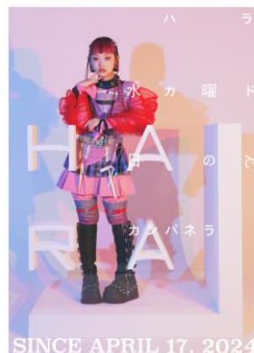
「ハラカド」開業を記念したショートフィルムに主演した「水曜日のカンパネラ」詩羽さん