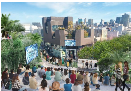
「ハラカド」屋上テラスから望む「オモカドビジョン」

「ハラカド」は、これまで様々なカルチャーを生み出してきた原宿・神宮前エリアが持つ歴史や、SNSを通じて誰もが発信や自分なりの表現を行う現在の時代背景から、新しい体験価値を享受できる場所として、「商業施設」ではなく「創造施設」を目指します。その実現のため、クリエイターを育成・支援・共創するプラットフォームや、リアルな価値を最大限活用する3種の新しい体験型メディアを実装し、チャレンジマインドあふれる個性豊かな75店舗を地下1階から屋上テラスまでの全フロアに揃えました。