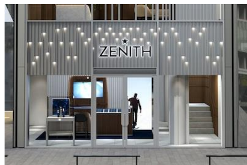
「ゼニス ブティック表参道」 店舗イメージ

1階の明治通りに面した区画には「ゼニス ブティック表参道」が、2024年4月17日(水)にオープンします。150年以上に渡り、スイスの時計製造をリードするウォッチマニュファクチュールゼニス。メゾンを象徴する星からインスピレーションを得た、輝くライティングが印象的な最新デザインの空間にて、ゼニスの歴史とクラフトマンシップを堪能できる世界観と共にショッピングの時間をお楽しみいただけます。最新コレクションをはじめブティックエディションなど豊富なラインナップをご用意いたします。