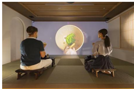
HANARE by Tokyu Stay「茶幻 ~sagen~」 伝統文化とテクノロジーが融合したデジタル茶室空間