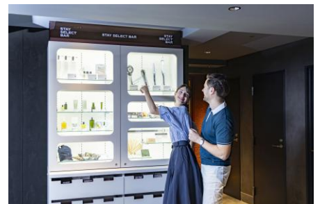
“セルフ”アメニティボックス「STAY SELECT BAR」 日本の美意識を持つブランドの厳選セレクト商品