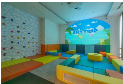
東急ステイ沖縄那覇「SKY TRIP」 アナログとデジタルが交わるキッズスペース

【姉妹ブランド】 nol kyoto sanjo（京都市中京区）、nol hakone myojindai（神奈川県箱根町）