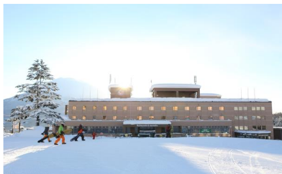
ゲレンデ直結 ホテルニセコアルペン