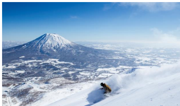
羊蹄山を一望できるスキー場

昨年度はリフト待ちの混雑を解消するために「エースファミリーリフト」をリニューアルしたほか、キッズパークを新たにオープンし、より親子でも安心して利用できるようになりました。羊蹄山を一望できるレストラン「タンタ・アン」では、インスタ映えする「NTB（ニセコ・ツリー・バーガー）」がスキーヤーのお腹を満たします。海外からのスキーヤーが多いニセコでは英語専門のスクールも実施。ニセコマウンテンリゾート グラン・ヒラフに面する「ホテルニセコアルペン」では、温泉をはじめ岩盤浴やボディケアなどの様々なリラクゼーションが充実しています。