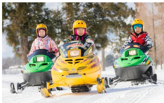
5歳から乗車OK! 「スノーモビル」