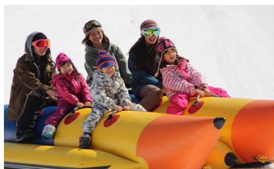
家族で楽しめるアクティビティが充実