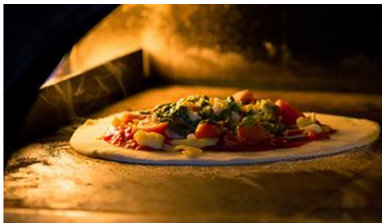
高温で焼き上げる「ハンタママルゲリータ」