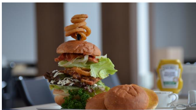
ニセコ・ツリーバーガー