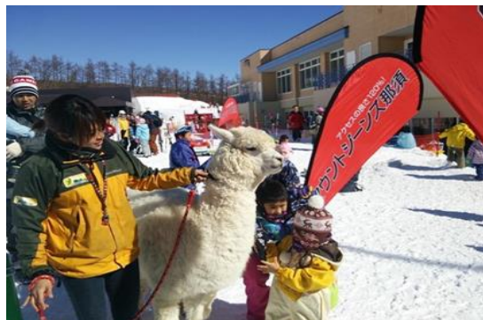
出張どうぶつ王国