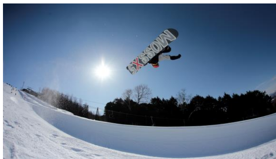
レギュラーパイプ