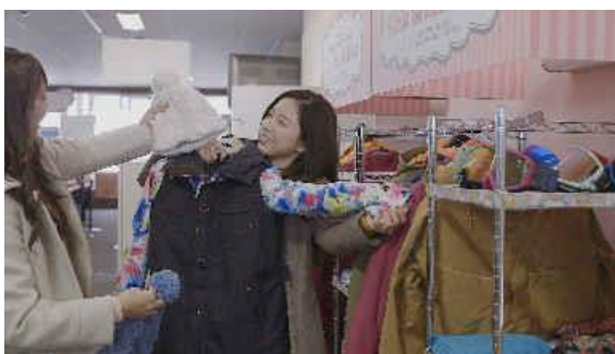
女性に人気のブランドが勢ぞろい

手ぶらでもお洒落に楽しめるようにレンタルウェアが充実し、特に女性限定のブランドレンタルウェアは「burton」や「roxy」「sister.j」などの人気ブランドをラインナップ。西日本最大級のスキー場はキッズ&ビギナーパークも西日本最大級。恐竜をテーマにした通称「ビキッズパーク」では、かわいい恐竜モニュメントや遊具が充実しており、リフトではなくムービングベルトも備えているのでスキー、スノーボードに不慣れな方でも安心です。今年度は25周年を記念したイベントやキャンペーンも盛りだくさんです。