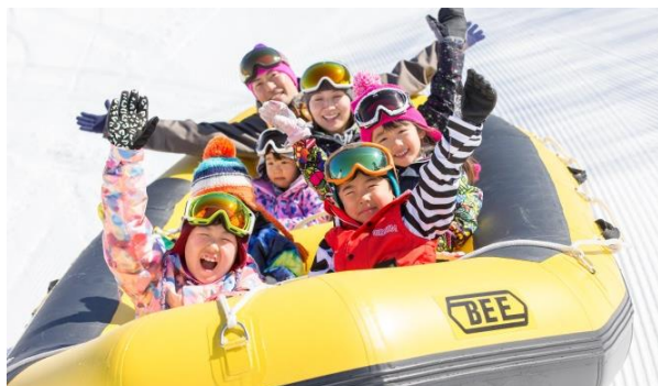
雪原を疾走! 「スノーラフティング」