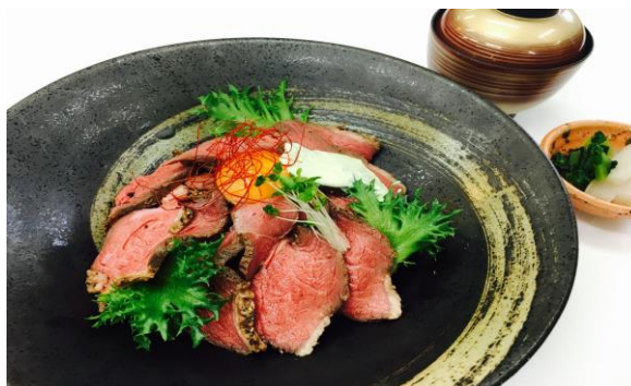
大人のローストビーフ丼