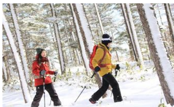
初心者から楽しめるスノーシュー