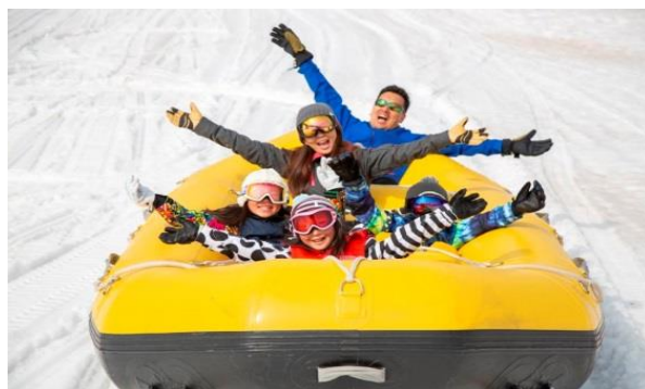
スノーラフティング