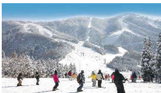
西日本最大級のビッググレンデ