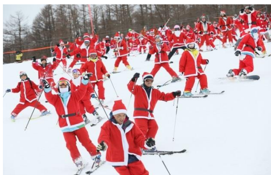
クリスマス in マウントジーンズ

そのほかにも雪道用に作られたタイヤが太い自転車で林道を疾走する「ファットバイクツアー」や、愛犬も同伴可能でスノーシューズを履いて自然を観察しながら探検する「スノーシューツアー」など、スキー以外のコンテンツも充実しています。