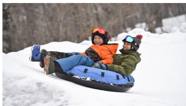
家族で楽しめるたんばランド