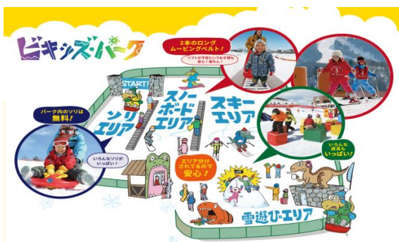
キッズ&ビギナーパーク