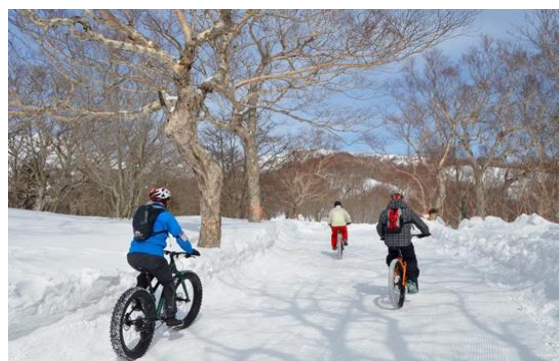
ファットバイクツアー