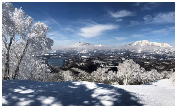
「野尻湖テラス観光リフト」上部からの眺め