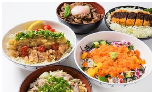
信州の味が勢ぞろい