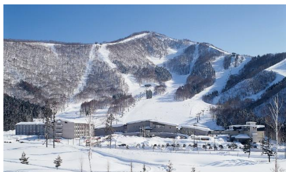
ゲレンデからウォークイン「ホテルタングラム」

小さなお子様や親子三世代での利用も多く、滑る以外のアクティビティも充実しています。スノーエスカレーターを備えた「キッズパーク」、5歳から乗れる「スノーモビル」、スノーモビルが引くボートで雪原を疾走する「スノーラフティング」、センターハウス内には「ボルダリング」、「室内プール」、「温泉露天風呂」もあります。また、「野尻湖テラス観光リフト」に乗れば、スキーをしない方も標高1,100mの展望ラウンジから野尻湖や北信五岳の素晴らしい眺望を楽しむことができます。