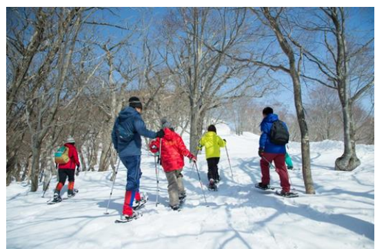
スノーシューツアー