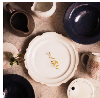
アベノのお店 カタルテ