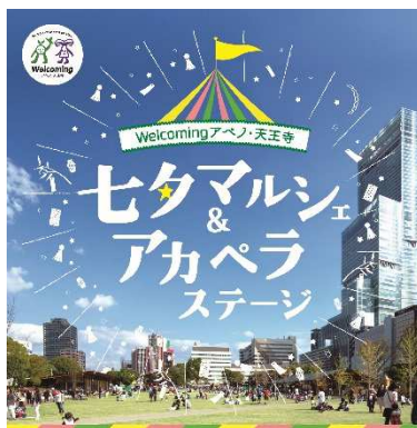
七夕マルシェ&アカペラストージ キービジュアル