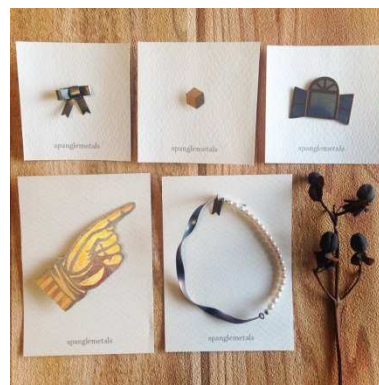
天王寺のお店 きになる舎