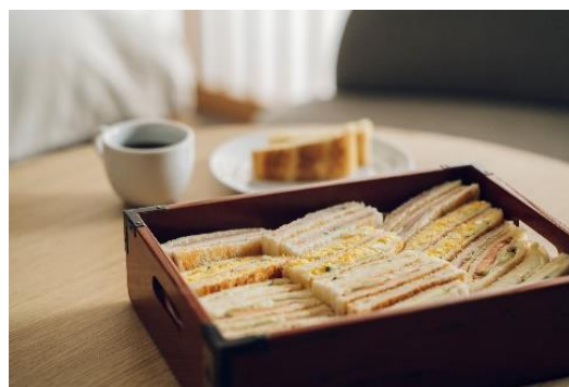
「コーヒーショップナカタニ」

洋食では、歌舞伎役者や舞妓さん御用達の老舗喫茶「コーヒーショップナカタニ」看板メニューである「たまごサンド」も含めたサンドウィッチをご用意。カリッと焼き上げた、香ばしい食感をお楽しみいただけます。またサンドウィッチは、京都ならではの趣ある“おかもち”に収まっていて、趣ある朝食を演出いたします。