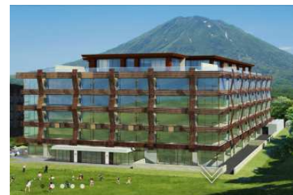
2016年12月に開業した綾・ニセコ