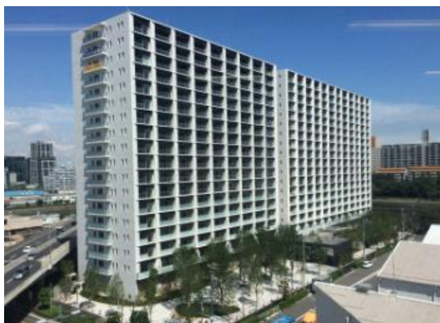
「プランズシティ品川勝島」(2015年7月竣工)でも全戸にエネファームを設置。高い省エネルギーを実現。