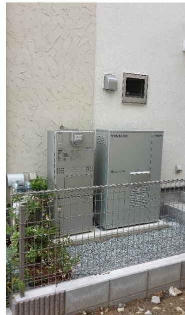
エネファーム導入部

※3. 次世代エネファームが発電していない時に停電が発生した場合は、自立運転に切り替わりません