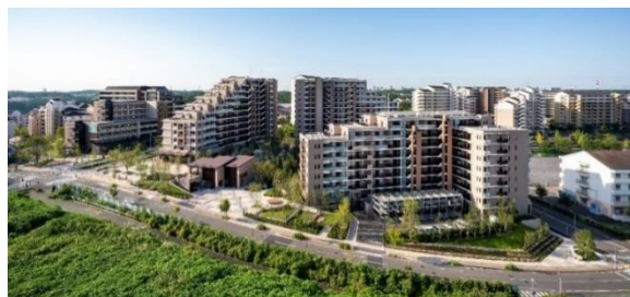
▲20街区全体写真 2019年9月撮影

今後も横浜市と本事業者は、十日市場町および周辺地域の住民などと連携し、プロジェクトやエリアマネジメントを通じて魅力ある十日市場ブランドの創造や、周辺地域の価値向上、街のさらなる活性化を図っていきます。