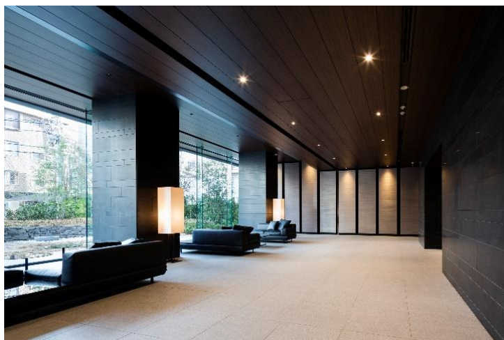
ブランズ六番町 左、右上) 外観 右下) エントランス