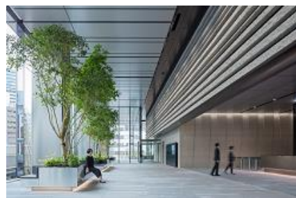
(左) 外観 (右上) 21階スカイテラス (右下) 2階エントランスロビー