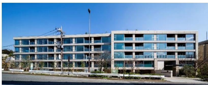
ブランズニ子玉川テラス