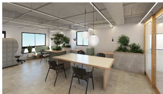
<I/O shimbashi 5階>