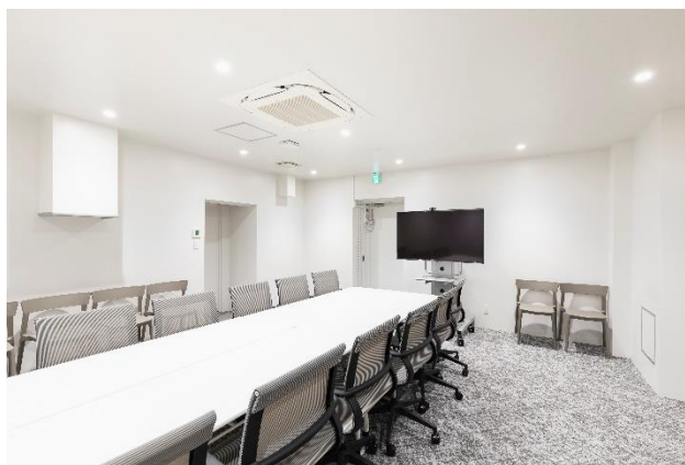
GUILD Dogenzaka 会議室