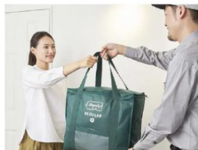
ドライバーがご自宅へ集荷