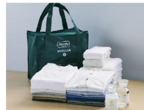
丁寧に梱包してご自宅まで お届け