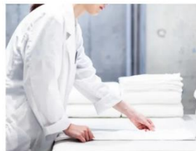
専用ファクトリーで 洗濯・乾燥・たたみ