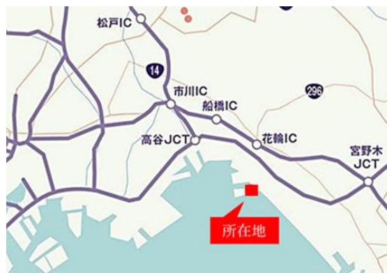
(LOG I'Q習志野 広域図)

所在地：千葉県習志野市茜浜3丁目33番11号 用途地域：準工業地域 主要用途：倉庫（倉庫業を営む倉庫） 敷地面積：8,308.08㎡（2,510坪） 延床面積：16,915.50㎡（5,117坪） 建物構造：鉄骨造3階建て（事務所4階建） 着工：2018年11月30日 竣工：2019年10月31日 監修（CM）：株式会社山下PMC 設計・施工：JFEシビル株式会社 事業主：東急不動産株式会社 床荷重：1.5t/㎡ 柱スパン：10.5m × 11.0m 梁天井有効高：5.5m トラックバース：11台 駐車場：普通自動車30台、車いす用スペース1台、トラック待機場1台