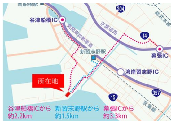
(LOG I'Q習志野 詳細図)