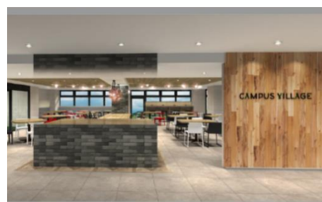
キャンパスヴィレッジ京都伏見（カフェテリア）