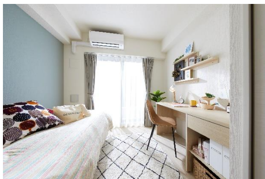
キャンパスヴィレッジ京都一乗寺のモデルルーム（東急ハンズコーディネート）