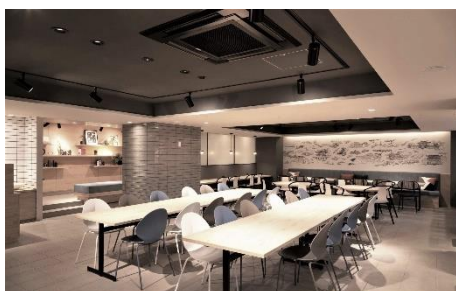
キャンパスヴィレッジ京都一乗寺（カフェテリア）

東急不動産株式会社（本社：東京都渋谷区、代表取締役社長：大隈 郁仁）が開発し、株式会社学生情報センター（本社：京都府京都市、代表取締役社長：吉浦 勝博）が運営する学生レジデンス「CAMPUS VILLAGE」シリーズにおいて、京都市内に新たに展開する「CAMPUS VILLAGE 京都一乗寺」が竣工しましたのでお知らせいたします。このほか京都市内では「CAMPUS VILLAGE 京都伏見」、首都圏では「CAMPUS VILLAGE板橋本町」など3物件が竣工し、シリーズ合計で9物件1,096室(3月末時点)の体制となります。