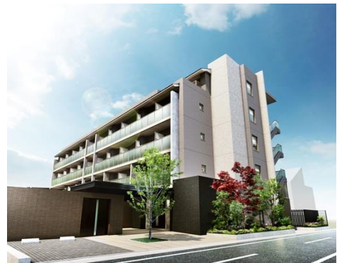
キャンパスヴィレッジ京都伏見（外観）

住 所：京都市伏見区竹田北三ツ杭町24番1（地番） 交 通：京都市営地下鉄烏丸線「くいな橋」駅徒歩4分 敷地面積：1,068.76㎡（323.29坪）（実測） 構造規模：鉄筋コンクリート造地上5階 延床面積：2,254.33㎡（681.93坪） 間 取 り：1R（16.28㎡～16.71㎡） スケジュール：2020年3月竣工、3月入居（予定）