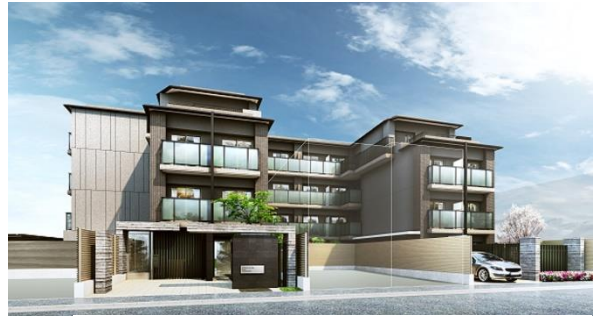
キャンパスヴィレッジ京都一乗寺（外観）

住 所：京都市左京区高野泉町6番109（地番） 交 通：叡山電鉄叡山本線「一乗寺」駅徒歩8分 敷地面積：1,372.30㎡（415.12坪）（実測） 構造規模：鉄筋コンクリート造地上4階 延床面積：2,874.38㎡（869.49坪） 間 取 り：1R（15.91㎡～21.23㎡） スケジュール：2020年3月竣工、3月入居（予定）