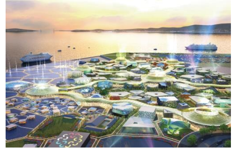
【大阪・関西万博 イメージ】