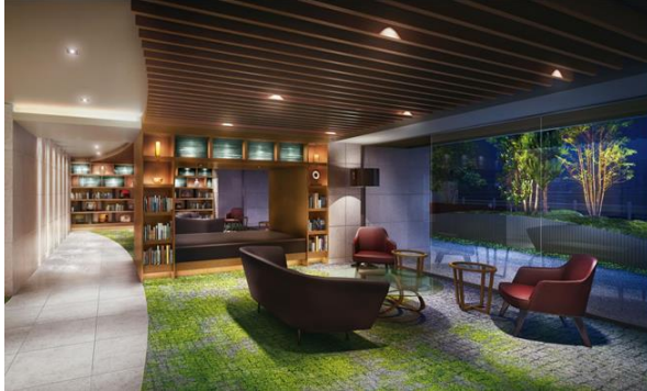
【ブックラウンジ イメージ】

海遊館および、ハイアットリージェンシー大阪がマンションと連携し、このようなサービスを行うのは初めての試みです。