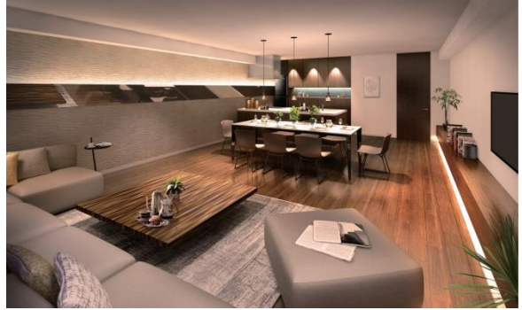
【パーティールーム イメージ】