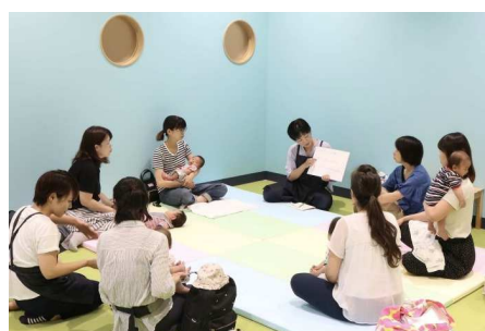
キューズランド・キューズ子育てつどいの広場内観（イメージ）