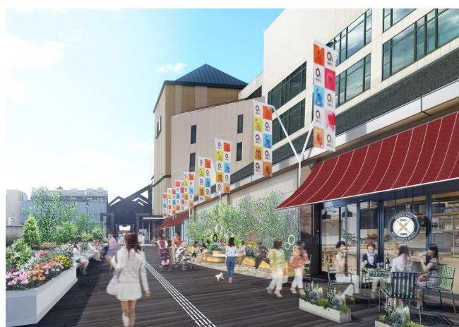
CENTER 棟デッキ部（イメージ）