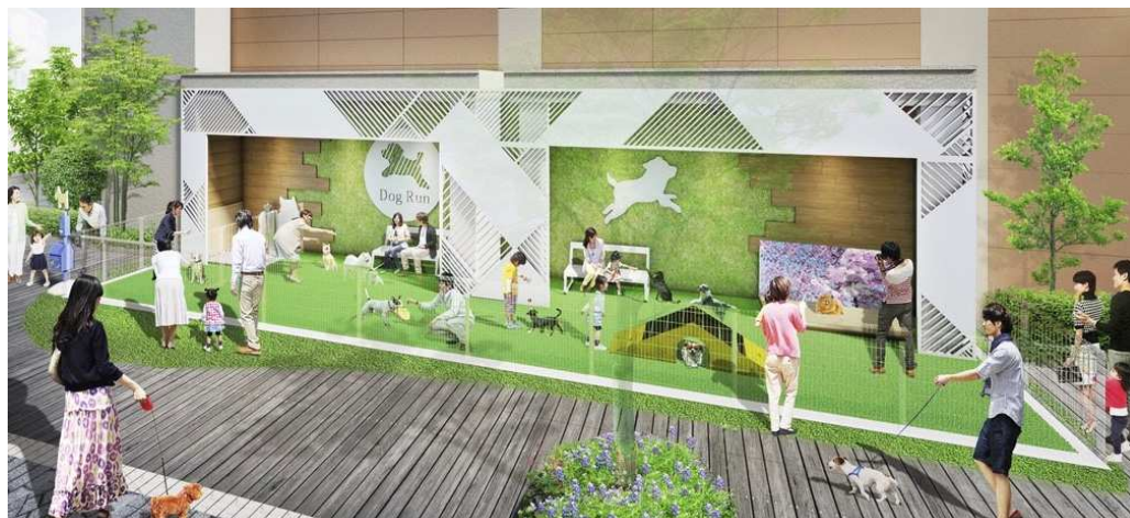
ドッグラン（イメージ）

キューズモールのブランドキャラクターである「ワンちゃん」も家族の一員として、一緒にお買い物に行きたくなる施設づくりに取り組みます。無料でご利用いただける小型犬用のドッグランを新設し、地域のワンちゃん好きの「ギャザリングプレイス」を提供します。さらにフォトスポットをはじめ、施設内各所にはリードフックを設置。排泄物を入れるボックスも用意するなど様々なサービスを提供します。また、ワンちゃんを主役にした「ギャザリングイベント」を開催し、一緒に楽しんでいただくことに加えて、しつけ教室も開催。ワンちゃんと人が豊かな生活を育むお手伝いをします。