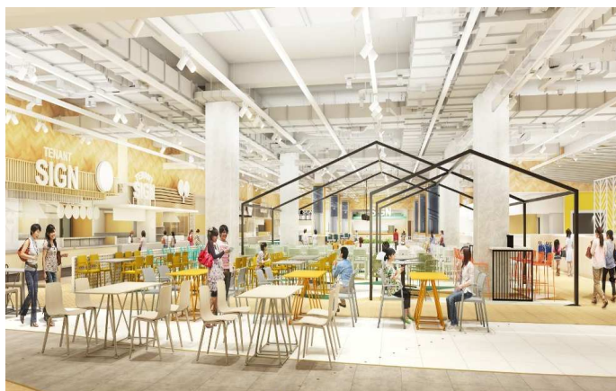
フードコート内観（イメージ）

フードコートの計画に先立ち、周辺にお住まいのママを対象に座談会を開催。「ママのあったらいいな！」という声を反映し、小上がり席やベビーカーを横付けできる席を設け、キッズトイレやオムツ替えコーナーを有するファミリートイレを近くに計画しました。また、「つどい」を生み出す地域のパーティールーム「キューズリビング」を設け、お客さま同士が自由にママ会やパーティー、ワークショップ・セミナーを開催できる場として貸し出します。