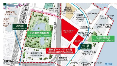
東京ポートシティ竹芝周辺地図

・チケット申し込み：公式サイト http://takeshiba-smartcity-fes.jp/