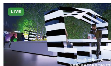
「スマートルーム」イメージ