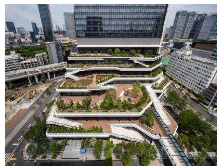
東京ポートシティ竹芝、スキップテラス