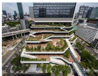
屋外スキップテラス

「東京ポートシティ竹芝」は、最先端のテクノロジーを活用した都市型スマートシティの実現により新たな国際ビジネス拠点を創出することを目的に、東京都の「都市再生ステップアップ・プロジェクト」の1つとして複合再開発を進めてきました。基幹を担うオフィスタワーには、入居予定のソフトバンク株式会社と共同で開発したビル内の状況をセンシング・解析したデータをリアルタイムに活用する最先端テクノロジーを搭載。様々なデータから収集したデータをリアルタイムに活用することで、ワーカーの利便性・快適性向上やビル管理の効率化に繋がる仕組みを導入しています。