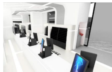
ローソンイメージ