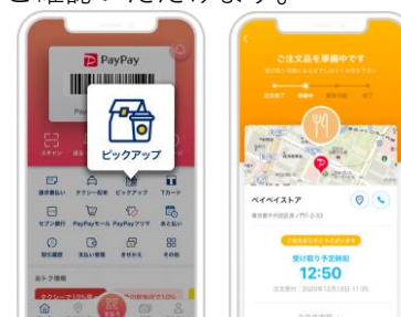
PayPay ピックアップ利用イメージ