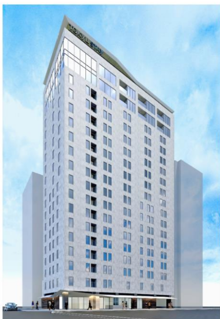
（ホテル外観イメージ）

本プロジェクトは、大阪市営地下鉄堺筋線・中央線「堺筋本町」駅より徒歩1分、御堂筋線「本町」駅より徒歩4分と都心にもアクセス良好な場所に計画しています。東急不動産ホールディングスグループで開発、管理、運営を一貫して行うことで、ホテル内のサービスをマンションの入居者も利用可能となるなど、ホテルライクな都心居住の新たなライフスタイルを提案してまいります。衣類のクリーニングや宅配便の取次ぎ等を行うホテルのコンシェルジュ機能をマンション入居者も利用できるサービスや、ホテルをゲストルーム感覚で割引して利用できるサービスなどを検討しております。