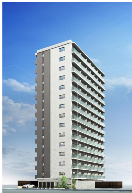
（分譲マンション外観イメージ）

※掲載の完成予想図は設計図を基に描き起こしたもので官公庁の指導、施工上の都合等により建物の計上・色調・植栽等に変更が生じる場合があります。また、外観形状の細部、設備機器、周辺の建物、電柱・電線は簡略化しております。