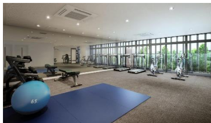
フィットネススタジオイメージ

東急スポーツオアシス監修のフィットネス動画が1000本以上（2020年1月現在）視聴可能なフィットネス動画の配信サービス「WEBGYM」を各戸へ配布し、初年度無料でご利用いただけます。本物件には、お住まいの方専用のフィットネススタジオを備えており、この動画を見ながらスポーツジム同様のレッスンをいつでも好きな時間に受けることができます。こちらもBRANZアプリ上で提供予定です。