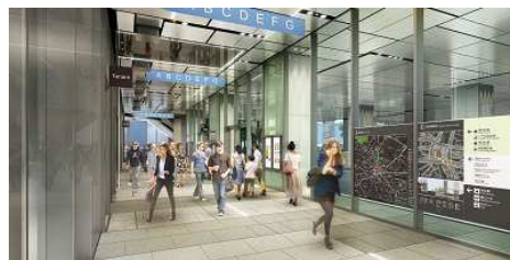
バスターミナル (イメージ)