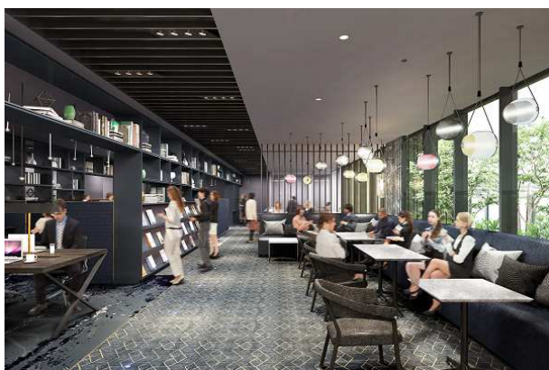
シェアワークプレイス (イメージ)

ターミナルである渋谷駅が目の前という利便性の高いロケーションの「ビジネスエアポート渋谷フクラス」は、他店舗と比較してシェアワークプレイス(ラウンジ)の面積比率を高めており、多くの方々に移動の隙間時間を有効活用した作業、商談やリフレッシュなどのためにご利用頂くことが可能です。見晴らしの良い17階で、緑や新鮮な空気を身近に感じながら生産性の高い働き方ができるよう、ビジネスエアポート専用の屋外テラスを設置しました。また、1階に空港リムジンバスが乗り入れるバスターミナルを有することから、グローバルに活動するワーカーの利用が予想され、利用者がいつでも快適に仕事や休息の時間を過ごせるよう、シャワーブースもご用意しました。